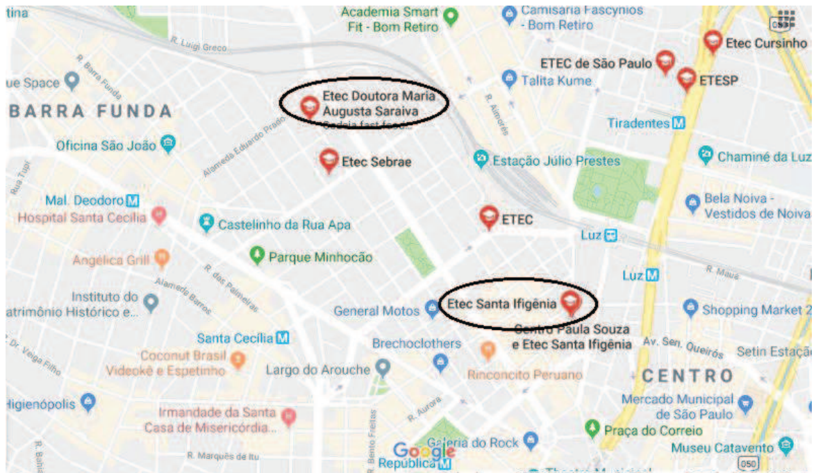
Figura 1: Mapa de localização das Etecs selecionadas para a pesquisa